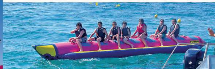
Vilanova i la Geltrú