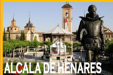
ALCALA DE HENARES

Suplemento individual 24 euros por persona y noche